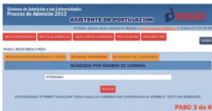
Figura N° 13

Para realizar una búsqueda por palabra específica, debes escribir la palabra en la casilla (Por ejemplo: VETERINARIA), y luego presionar el botón BUSCAR , como lo indica la Figura N° 13.