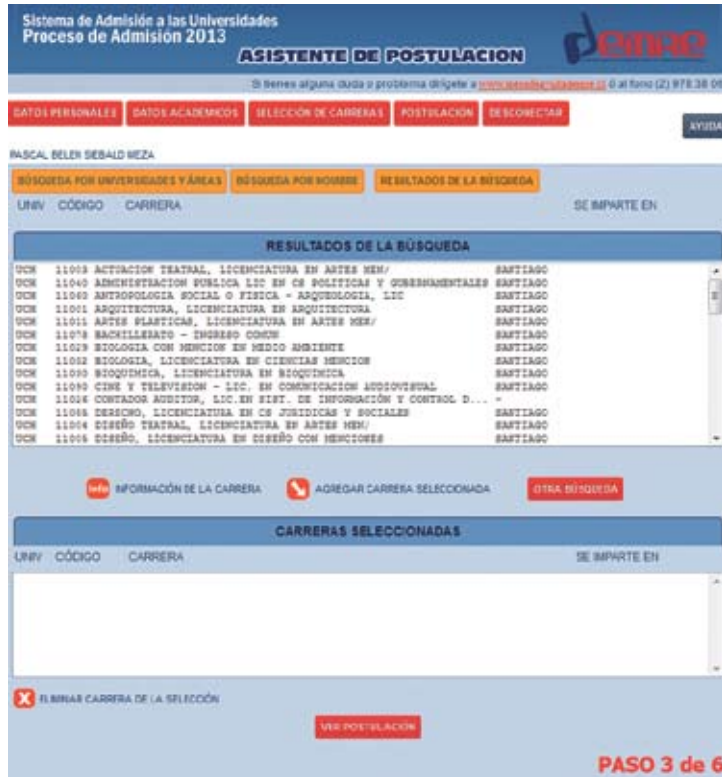
Figura N° 8

A continuación se desplegarán en la ventana RESULTADOS DE LA BÚSQUEDA todas las carreras pertenecientes a la Universidad escogida (Figura N° 8). Las carreras aparecerán ordenadas por código, y para conocer el listado completo puede bajar y subir con la barra de desplazamiento vertical.