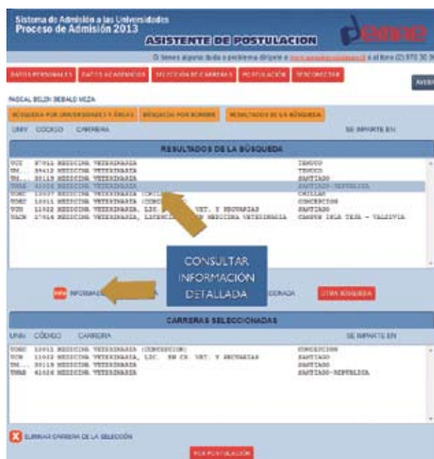
Figura N° 17

Y luego hacer click en el ícono para obtener la información requerida.