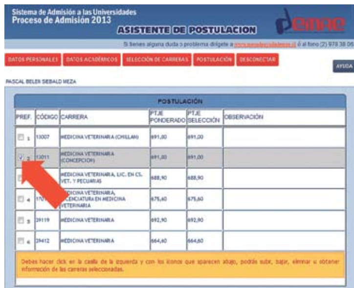
Figura N° 20

Se abre una nueva pantalla con el detalle de la carrera. (Figura N° 21)