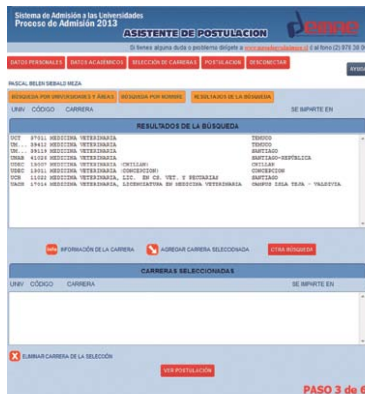
Figura N° 14

Se desplegarán en la ventana de RESULTADOS DE LA BÚSQUEDA , todas aquellas carreras que contengan la palabra que se escribió anteriormente. Para este ejemplo, aparecerán todas aquellas carreras que en su nombre contengan la palabra VETERINARIA (ver Figura N° 14). Si desea realizar una nueva búsqueda debe hacer click en el botón OTRA BÚSQUEDA .