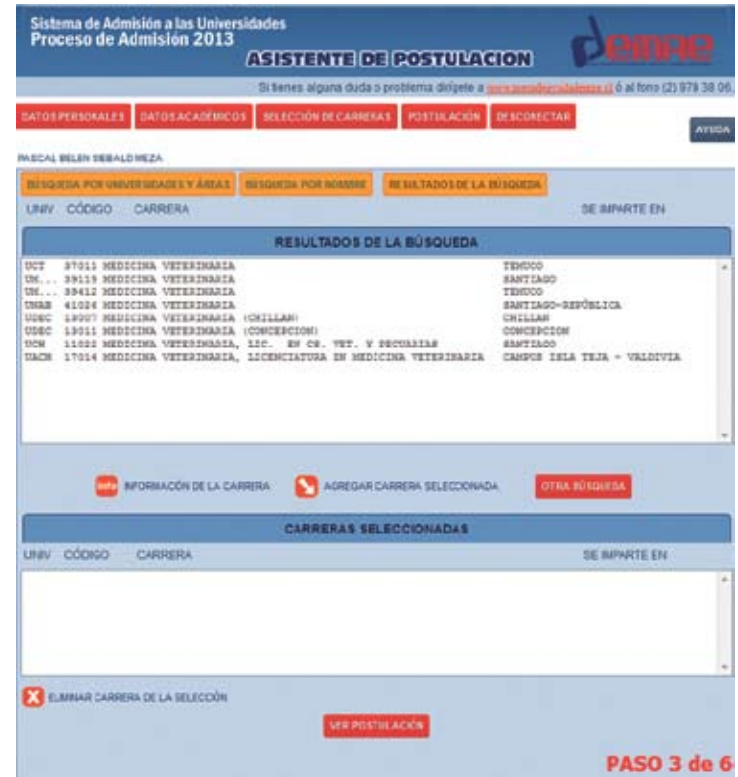
Figura N° 10

Se desplegarán en la ventana RESULTADOS DE LA BÚSQUEDA , todas las carreras pertenecientes al Área seleccionada (Figura N° 10), las cuales estarán ordenadas por código. Para ver todos los resultados de carreras, puedes bajar y subir con la barra de desplazamiento vertical.