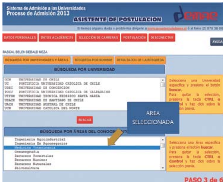
Figura N° 9

Para realizar la búsqueda por Área, debe seleccionar en el cuadro inferior el Área o Subárea de la cual desea conocer información de carreras. Posteriormente debe presionar el botón BUSCAR , como se indica en la Figura N° 9. Al seleccionar un área, podrá ver todas las carreras de las subáreas que pertenezcan a ella. Por ejemplo, se puede seleccionar el área de Medicina Veterinaria, y al dar la orden de búsqueda se desplegarán todas las carreras que están incluidas en esta área. Y si desea conocer carreras de más de un Área, debes utilizar la tecla Ctrl de su teclado y el puntero del mouse; en este caso, el resultado de carreras contemplará las dos áreas seleccionadas. Para quitar la selección, debe proceder de la misma manera (Ctrl + puntero del mouse). Para ubicar todas las carreras de una determinada Área o Subárea, debe evitar seleccionar una Universidad en el cuadro superior.