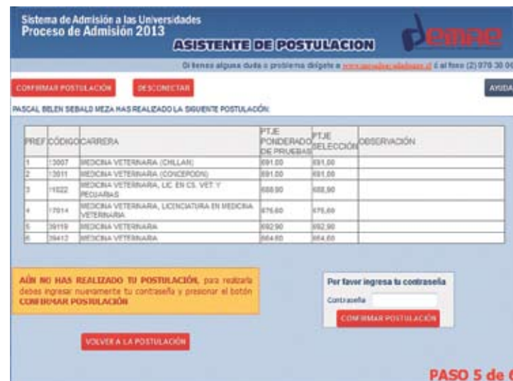
PASO 5 de 6

Una vez ordenadas sus preferencias y presionado el botón Postular, entrará en el quinto paso del asistente: Confirmación de la Postulación (Figura N° 22).