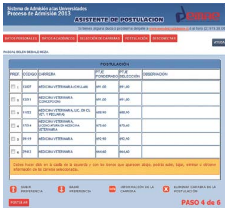
Figura N° 19

NOTA: EN EL CASO DE QUIENES POSTULAN CON PUNTAJES DE DOS AÑOS, EN ESTE RESUMEN APARECERÁ EL MEJOR PUNTAJE PONDERADO SEGÚN CADA CARRERA SELECCIONADA. INDICARÁ EL PROCESO DEL CUAL SE SELECCIONÓ EL PUNTAJE.