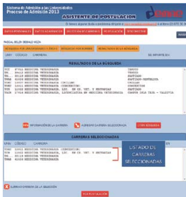
Figura N° 16

Finalmente, debe presionar el botón VER POSTULACIÓN para visualizar y, posteriormente, confirmar su postulación transformándola en definitiva (Paso 4).