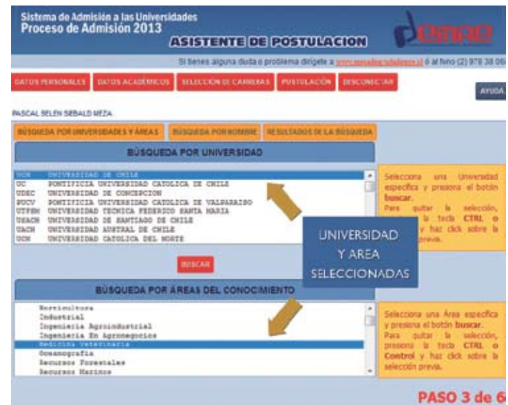
Figura N° 11

Para realizar la búsqueda combinada por Universidades y Áreas, debe seleccionar primero en el cuadro superior la Universidad de la cual desea información de carreras. A continuación, en el cuadro inferior, seleccionar el Área o Subárea deseada. Una vez efectuadas las selecciones en ambos cuadros, debe presionar el botón BUSCAR , como se indica en la Figura N° 11. En el ejemplo, se puede apreciar que están seleccionadas la Universidad de Chile, en el cuadro superior, y Medicina Veterinaria, en el inferior. Si desea seleccionar más de una Universidad o Área, debe utilizar la tecla Ctrl y el puntero del mouse. Para quitar la selección, debe proceder de la misma manera (Ctrl + puntero del mouse). Este tipo de búsqueda permite restringir la obtención de resultados a una determinada área de carreras y a una o más Universidades.