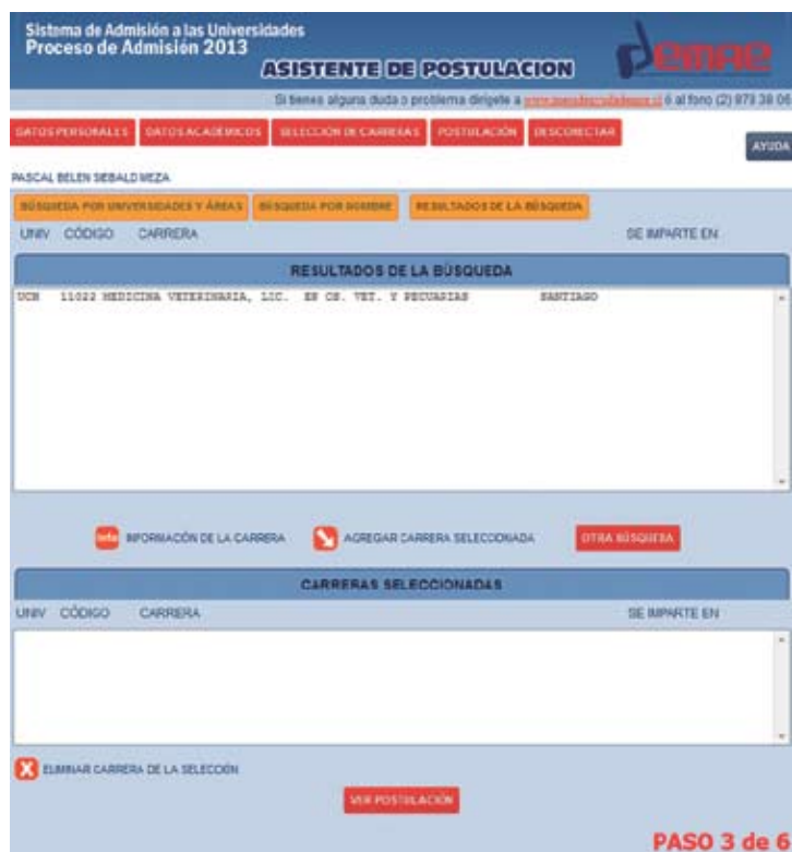
Figura N° 12

A continuación, se desplegarán bajo el título RESULTADOS DE LA BÚSQUEDA , todas las carreras pertenecientes a la/s Universidad/es y Área/s seleccionadas (Figura N° 12). Estas aparecerán ordenadas por código. Para recorrer todas las carreras, puedes bajar y subir con la barra de desplazamiento vertical.