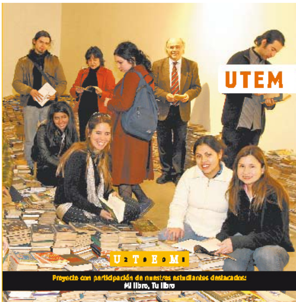
Proyecto con participación de nuestras estudiantes destacadas: MI Libro, Tu Libro