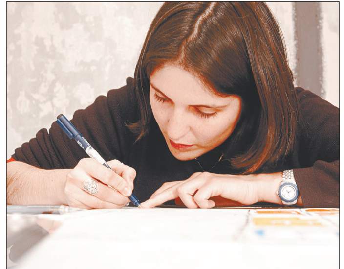
Figura N° 10