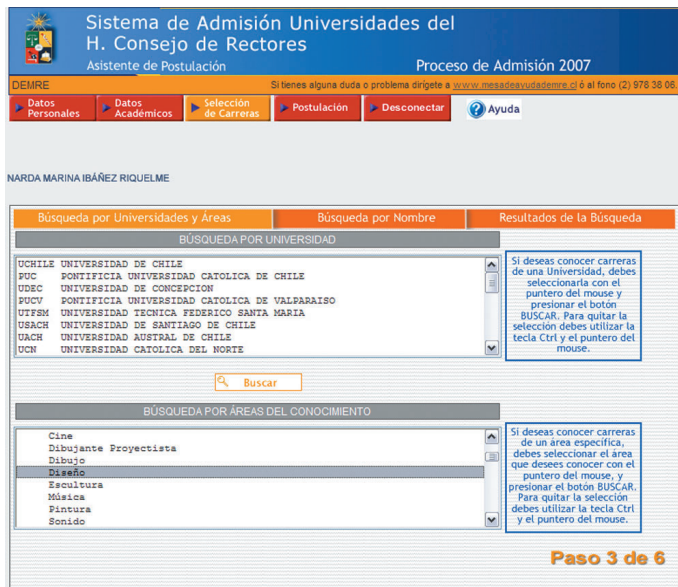
Figura N° 7

Para ubicar todas las carreras de una determinada Área o Subárea, debe evitar seleccionar una Universidad en el cuadro superior.