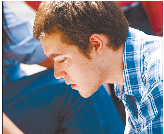
Figura N° 12