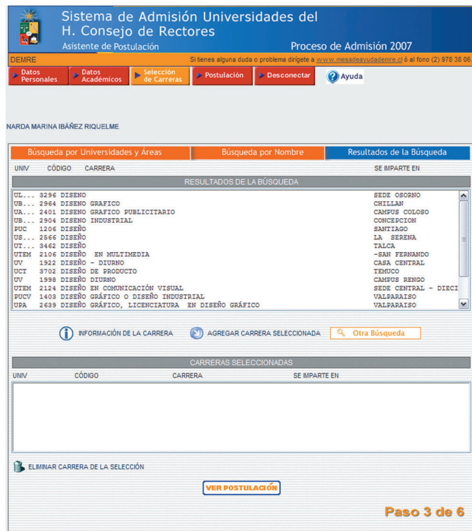
Figura N° 8

A continuación, se desplegarán en la ventana RESULTADOS DE LA BÚSQUEDA todas las carreras pertenecientes al Área que escogió (Figura N° 8). Aparecerán ordenadas por código. Para ver todos los resultados de carreras, puede bajar y subir con la barra de desplazamiento vertical.