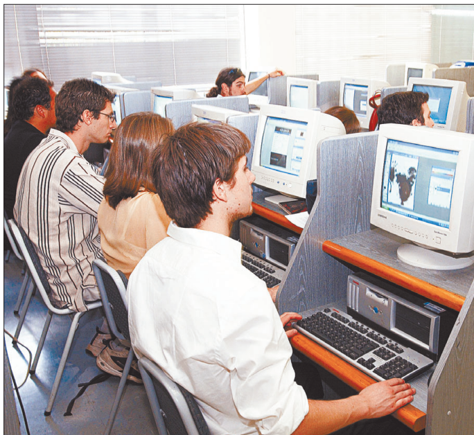
Figura N° 5