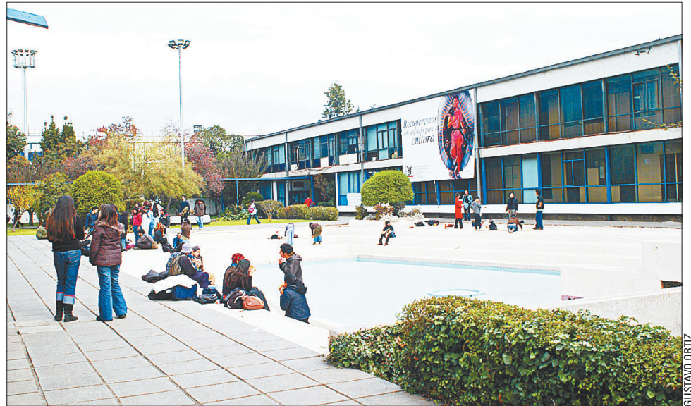
La comunidad académica está comprometida y participa en todas las actividades docentes.

Es importante destacar que el prestigio de la universidad, junto con el trabajo coordinado de un comité permanente, formado por las Direcciones de Extensión, de Asuntos